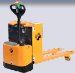
STP-EDH 18/20/22 Elektro-Deichselhubwagen

Ladepazität: 1500 kg - Hub: 200 mm Maximale Paletten-Breite: 1200 mm Breite: 1640 mm - Länge: 1413 mm Höhe: 800 mm - Gewicht: 150 / 262 kg