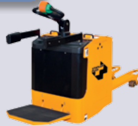
STP-EDH 20MP Elektro-Deichselhubwagen

Gabellänge: 1195 mm Tragkraft: 1800/2000/2200 kg Hubhöhe: 205 mm