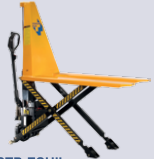
STP-ESHIL Scherenhubwagen Elektrohub

Als Arbeitstisch und Hubwagen verwendbar, Hubhöhe 800 mm, manuell heben/senken, Tragkraft: 1000 kg