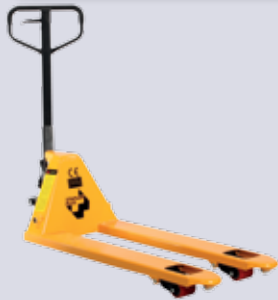
STP-HW 10/15/25/30 Handhubwagen

Gabellänge: 1150/1500/1800/2000 mm Tragkraft: 1000/1500/2500/3000 kg