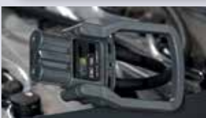
ALEX - Batteriecontroller Alex verlängert die Lebensdauer Ihrer Batterien und reduziert Ihre Batteriekosten.