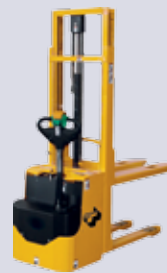
STP-EDS 12,5 C Elektro-Deichselstapler

Gabellänge: 1100 mm Tragkraft: 1000 kg Hubhöhe: 1600-3000 mm