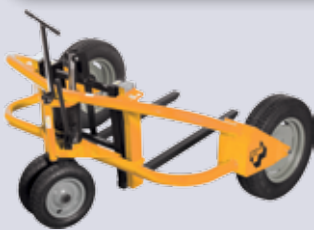
STP-GHW - manuell / elektrisch

Ladepazität: 1500 kg - Hub: 200 mm Maximale Paletten-Breite: 1200 mm Breite: 1640 mm - Länge: 1413 mm Höhe: 800 mm - Gewicht: 150 / 262 kg