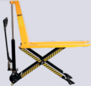
STP-SHW 10 Scherenhubwagen manuell

Als Arbeitstisch und Hubwagen verwendbar, Hubhöhe 800 mm, manuell heben/senken, Tragkraft: 1000 kg