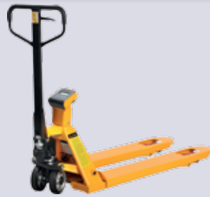
STP-HW 20 WAAGE Handhubwagen mit Waage

Gabellänge: 1150/1500/1800/2000 mm Tragkraft: 1000/1500/2500/3000 kg