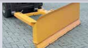
SCHNEESCHIEBER Breite 1600 / 1800 / 2000 mm, mit Einfahrtaschen für Gabelzinken.