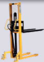
STP-HST 10G/1030 Handstapler

Gabellänge: 1150 mm Tragkraft: 1000 kg Hubhöhe: 1600-3000 mm