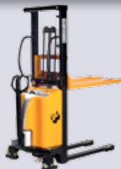
STP-EHST 1016/1025/1030 Handstapler mit Elektrohub

Gabellänge: 1150 mm Tragkraft: 1000 kg Hubhöhe: 1600-3000 mm