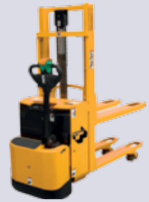
STP-EDD 12,5/18/20 IS Elektro-Doppelstockstapler

Gabellänge: 1150 mm Tragkraft: 2000 kg Hubhöhe: 120 mm