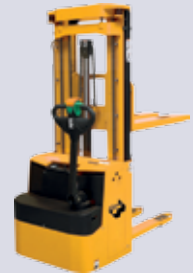
STP-EDS 16 C Elektro-Deichselstapler

Gabellänge: 1195 mm Tragkraft: 1250 kg Hubhöhe: 1790-2890 mm