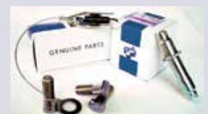
ERSATZTEILE von Stapler Plus